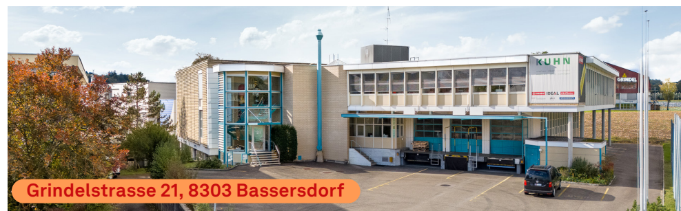
Grindelstrasse 21, 8303 Bassersdorf